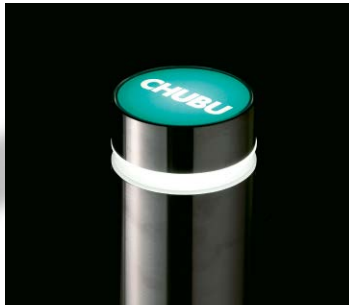
オリジナルデザイン