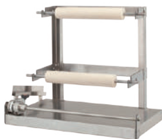
めん棒専用ラック