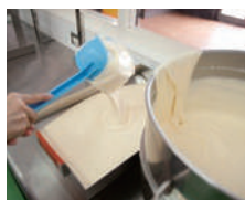
①生地を本体にセットします。