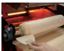
④ヘラを使って形を整えます。