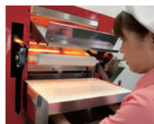
②めん棒を本体にセットします。