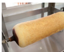
⑥焼成後ラックに掛けます。