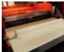
③ハンドルを操作し、めん棒に生地を付けます。