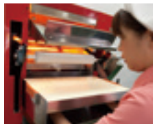
②めん棒を本体にセットします。