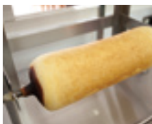
⑥焼成後ラックに掛けます。