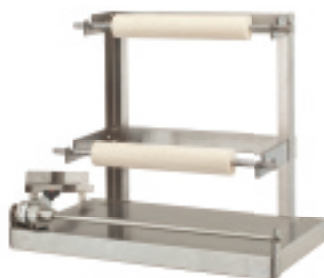
めん棒専用ラック