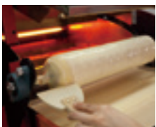
④へらを使って形を整えます。