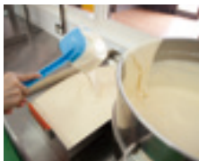
①生地を本体にセットします。